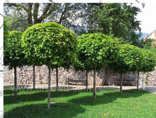
KLON ZWYCZAJNY 'GLOBOSUM'