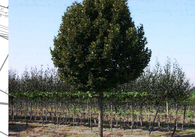
LIPA WIELKOLIŚNIA 'ZELZATE'