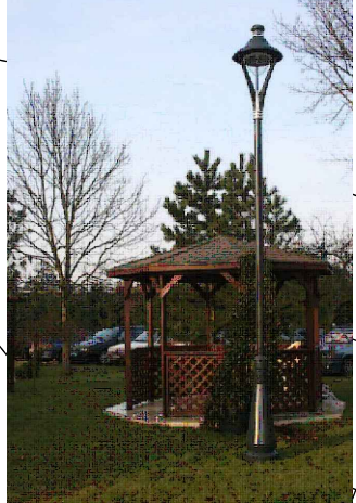
PROPONOWANY STYL LATARNI